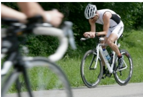
Die perfekten Herausforderungen

Noch nicht einmal drei Jahre ist es her, seit der Ironman 70.3 in der Schweiz in Rapperswil seine Premiere feierte. Mittlerweile hat sich die Distanz an allen Fronten etabliert und weist auch für die Zukunft ein enormes Potenzial auf.